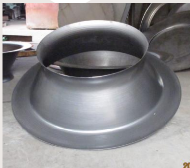
风机集风口 使用圆板一次旋压成型。

数控旋压机适合制造小于1600mm的进风口、前盘、屋顶风机风帽、管道风机、隧道风机轮毂、斜流风机外壳等零件，具有成型一致性好、尺寸精度高、材料利用率高等优点。大于1600mm的进风口、前盘等产品由于材料尺寸限制，需要进行拼接后成型，因此比较适合采用数控翻边机进行成型。