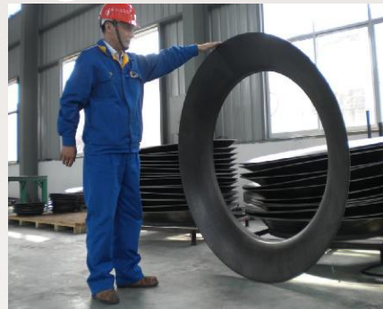
旋压前盘 圆板旋压成型