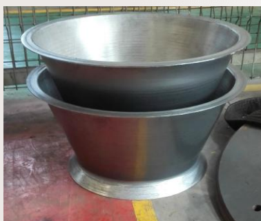
斜流风机，使用圆板旋压成型