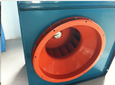
旋压进风口，光洁度高